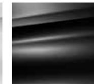
Črna Onyx (N)