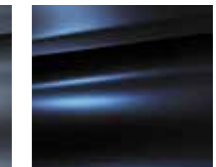
Modra Impérial (N)