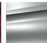
Siva Aluminium (K)