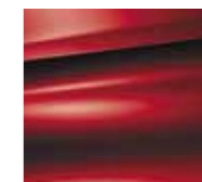
Rdeča Ardent (N)