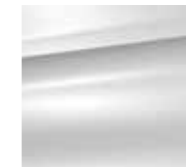
Bela Banquise (N)