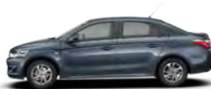
MODRA KYANOS (K)