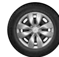
OKRASNI POKROV ASTÉRODÉA 15"