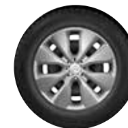
OKRASNI POKROV WHALETAIL 15"