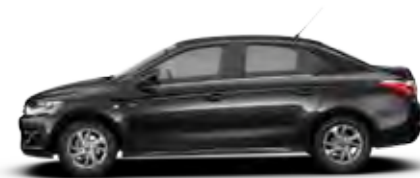
ČRNA ONYX (N)