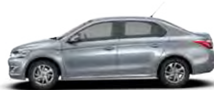
MODRA TELES (K)