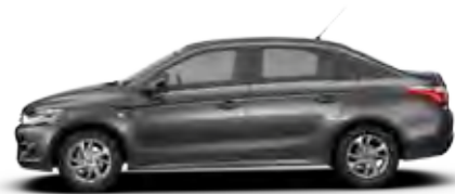
SIVA SHARK (B)