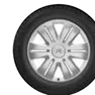
VARNOSTNI OKRASNI POKROV 15**