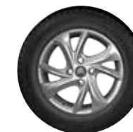
PLATIŠČE TUORLA 15"