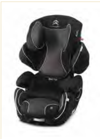
Izbor otroških avto sedežev