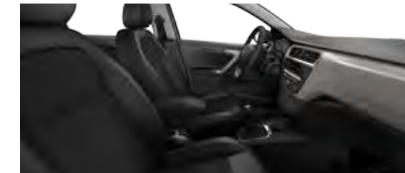
KOMBINACIJA USNJA IN TKANINE SPY MISTRAL / TKANINA SERGOR MISTRAL