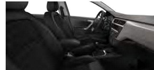
TKANINA WAXE MISTRAL / TKANINA SERGOR MISTRAL