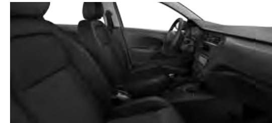
TKANINA CUBISA MISTRAL / TKANINA SERGOR MISTRAL