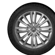
PLATIŠČE BOSTON 16"