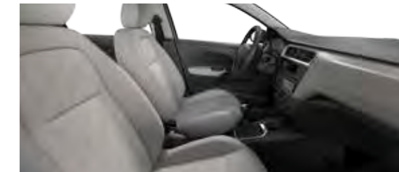
TKANINA BIRDY LAMA / TKANINA SERGOR LAMA