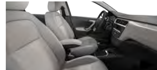
TKANINA WAXE LAMA / TKANINA SERGOR LAMA