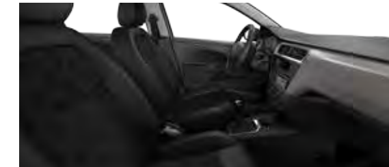
TKANINA BIRDY MISTRAL / TKANINA SERGOR MISTRAL