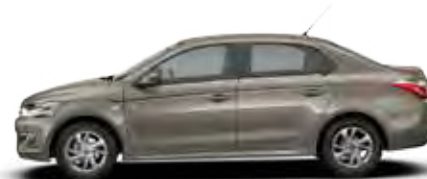
RJAVA NOCCIOLA (K)