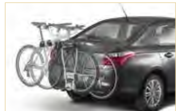
Nosilec za kolesa na vlečni kljuki

CITROËN C-ELYSEE si je mogoče z lahkoto prikrojiti po svoji meri, saj je zanj na voljo bogata ponudba praktične dodatne opreme