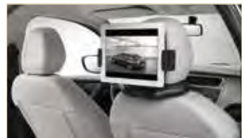
Nosilec za multimedijске naprave