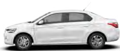
BELA BANQUISE (N)