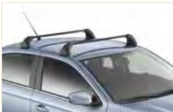
Strešni prtljažni drogovi