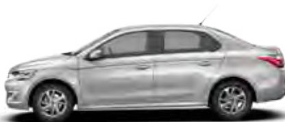
SIVA ALUMINIUM (K)