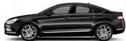
ČRNA PERLA NERA (B)