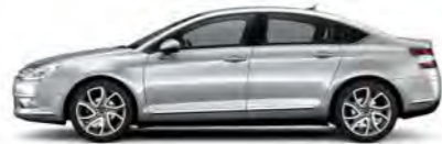
SIVA ALUMINIUM (K)