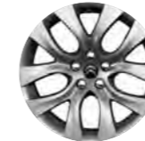
PLATIŠČE ATLANTIQUE 18" (2)