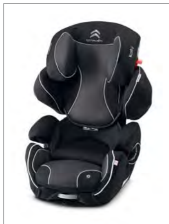
Izbor otroških avto sedežev