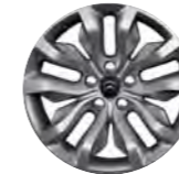
PLATIŠČE EGÉE 17"