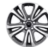
PLATIŠČE IONIENNE 17" Z DIAMANTNIM REZOM (2)