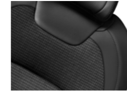
TKANINA SAINT-CYR / ZRNASTO USNJE MISTRAL (1)