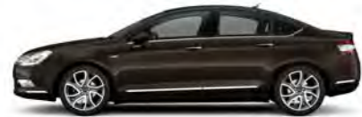
RJAVA GUARANJA (B)