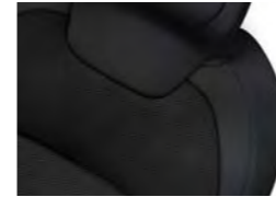
TKANINA FYBER MISTRAL (1)