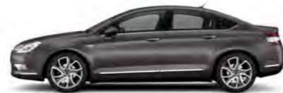
RJAVA MOKA (B)