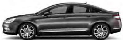
SIVA SHARK (B)