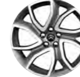
PLATIŠČE ADRIATIQUE 19" V SVI BARVI HEPHAÏS (3)