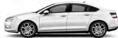
BELA NACRÉ (B)