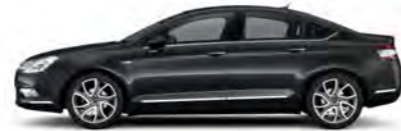
SIVA HARIA (B)