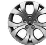
PLATIŠČE BALTIQUE 17"