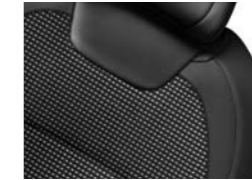
TKANINA ANDORRE GLOSS / ZRNASTO USNJE MISTRAL (1)