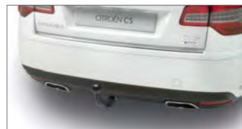
Vlečna kljuka z dolgim vratom