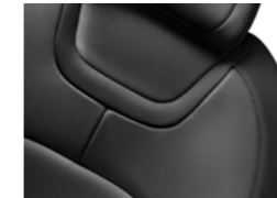
ZRNASTO USNJE MISTRAL (1)