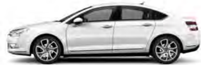
BELA BANQUISE (N)