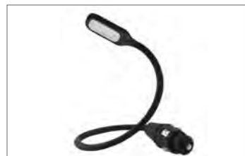
Prenosna bralna lučka