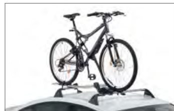
Nosilec za kolo na strešnih prtljažnih drogovih