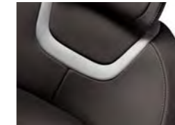
INTEGRALNO POLANILINSKO USNJE CRIOLLO (1)