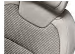
TKANINA ANDORRE GLOSS / ZRNASTO USNJE MATINAL (1)