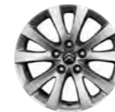
PLATIŠČE IROISE 16"