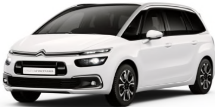
WPP0 Bjela Banquise

Predstavljene boje karoserija i presvlaka su informativne prirode, jer tehnike štampanja ne omogućavaju pouzdane reprodukcije boja.