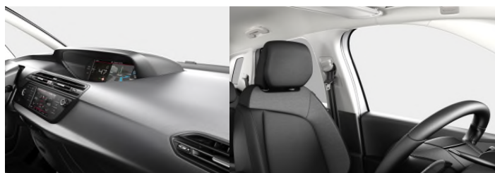
8LFT Obloge u tkanini Milazzo smeđa

Predstavljene boje karoserija i preslaka su informativne prirode, jer tehnike štampanja ne omogućavaju pouzdane reprodukcije boja.