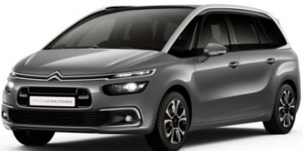
VLMO Siva Platinum