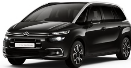
XYP0 Crna Onyx