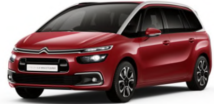
PYM0 Crvena Rubi