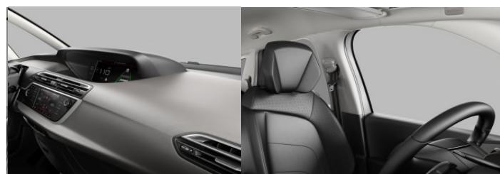
8PFR AMBIENT HYPE SIVA koža