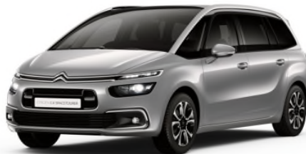
F4M0 Siva Artense