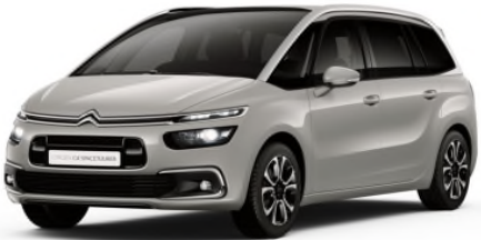
EUM0 Siva Sable