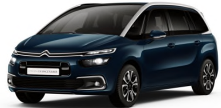
CNM0 Plava Alchemy