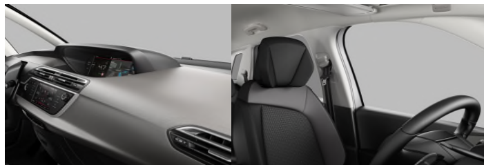
1HFR AMBIENT HYPE SIVA tkanina/koža