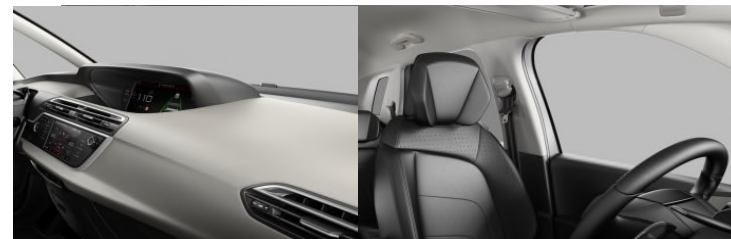
8PFC AMBIENT DUNE BEŽ koža