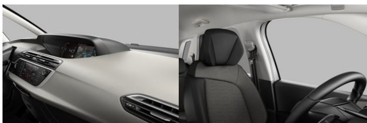
IXFC AMBIENT DUNE BEŽ tkanina