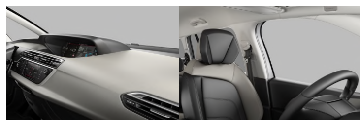
8QFC AMBIENT DUNE BEŽ nappa koža