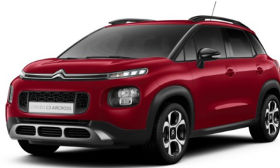
PQM0 Crvena PEPEROCHINO