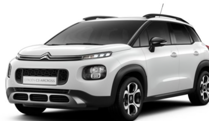
Z3P0 Bijela NATURAL