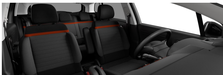
5CFY AMBIENT URBAN RED