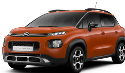
Z8M0 Narandasta SPICY