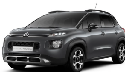
VLM0 Siva PLATINUM