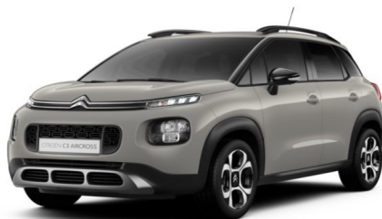
Z9M0 Siva SABLE