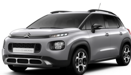
F4M0 Siva ARTENSE