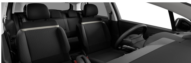
4YFT Unutrašnjost iz tkanine u sivoj boji Mika