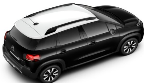
JD29 Krov u bijeloj boji NATURAL WHITE