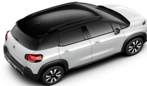
JD20 Krov u crnoj boji PERLA NERA