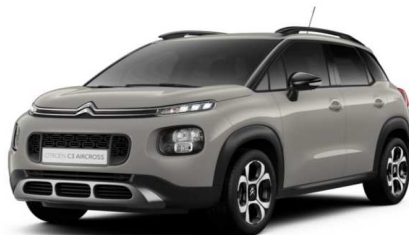
Z9M0 Siva SABLE