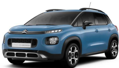
V6M0 Plava BREATHING