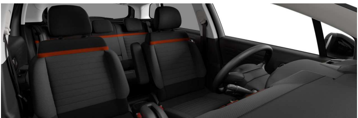
5CFY AMBIENT URBAN RED