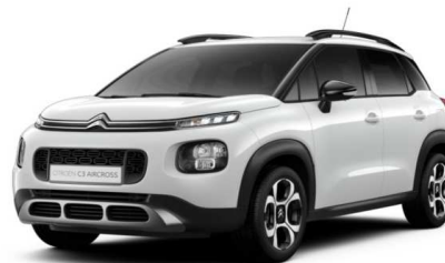
Z3P0 Bijela NATURAL