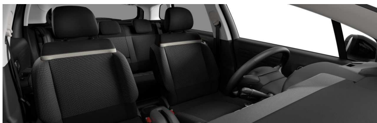
4YFT Unutrašnjost iz tkanine u sivoj boji Mika