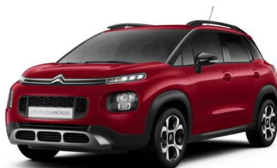
PQM0 Crvena PEPEROCHINO