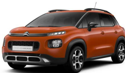
Z8M0 Narandasta SPICY