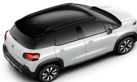
JD20 Krov u crnoj boji PERLA NERA