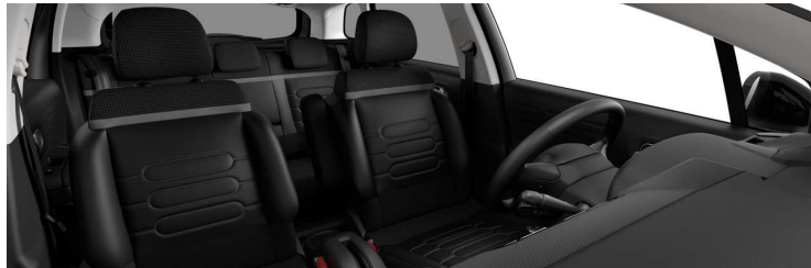
5DFY AMBIENT HYPE MISTRAL