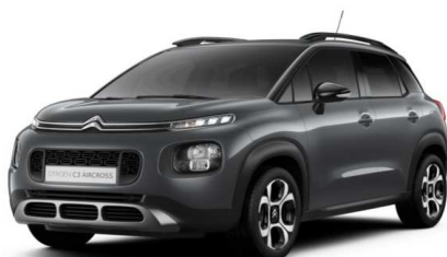
VLM0 Siva PLATINUM