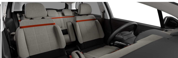
5AFC AMBIENT METROPOLITAN GREY