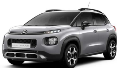
F4M0 Siva ARTENSE