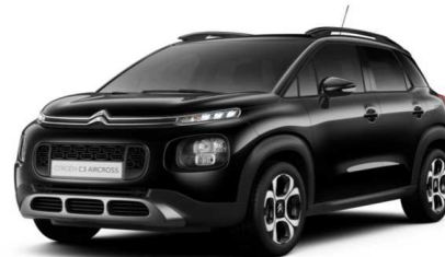
9VM0 Crna PERLA NERA