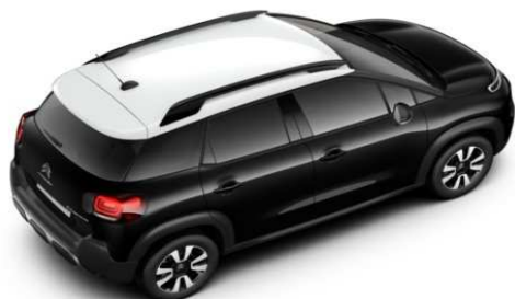
JD29 Krov u bijeloj boji NATURAL WHITE