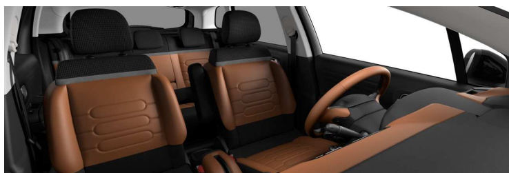
5DFF AMBIENT HYPE COLORADO